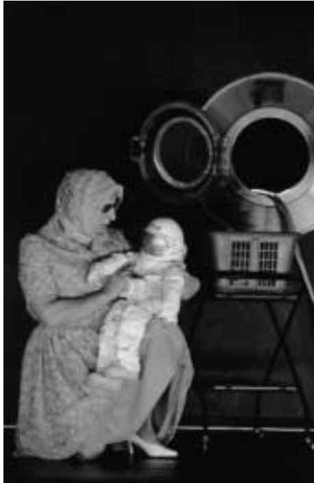
The far side of the moon – Ex Machina (Robert Lepage)

In 1989 heb ik besloten naar Montréal te emigreren. Drie jaar eerder had ik in Amsterdam een impresariaat opgericht: Les Bureaux Plukker . Naast verschillende producties in Nederland, zowel op het gebied van theater als moderne dans, organiseerde ik tournees voor gezelschappen in Nederland en soms ook in het buitenland. In 1987 reisde ik voor het eerst naar Montréal en ontmoette daar de directrice van het Festival de Théâtre des Amériques , Marie-Hélène Falcon. Zij stuurde me nog diezelfde avond van aankomst naar een voorstelling van Carbone 14. In hun eigen theater Espace Libre zag ik het stuk Opium – een fantastische, unieke en overweldigende ervaring van dynamiek, klank, kleur, decor, echt alles. Ik heb ze meteen uitgenodigd naar Nederland te komen. De voorstellingen van hun productie Le Rail in Utrecht bleken een daverend succes en kreeg een juichende kritiek in de Volkskrant . Daarna ben ik gevraagd om voor hen, en later ook voor het gezelschap van Robert Lepage, dat toen nog Théâtre Repère heette, tournees in Europa te organiseren. Met de persmappen in de achterbak ben ik toen met de auto door Europa gaan reizen om de theaters te bezoeken. Niet veel later kwamen er nog twee dansgroepen uit Montréal bij, Compagnie Marie Chouinard en O Vertigo Danse . Al snel werd me duidelijk dat het allemaal wat veel werd. De Nederlandse producties kon ik niet meer combineren met de buitenlandse reizen. Ik moest een keuze maken – of in Nederland blijven, of echt kiezen voor het interes-